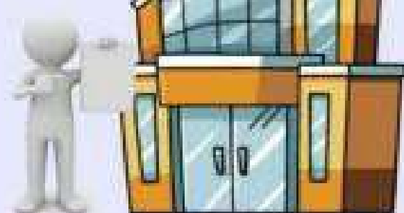
Ответственный за организацию питания